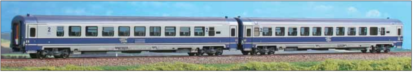
Set de două vagoane de clasa a doua de Tipul AVA 200 pentru trafic intern și extern aparținând Căilor Ferate Române. Versiunea gri. Set of two 2nd class coaches, Type AVA 200, for internal and international service of the CFR (Rumenian Railways). Gray livery.